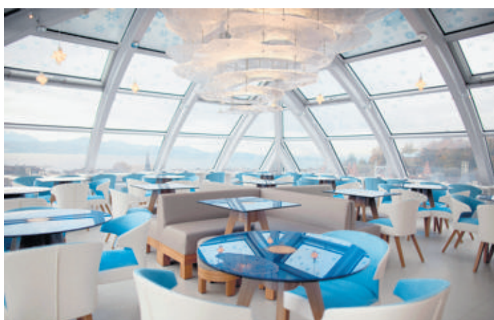
Vue panoramique sous la coupole du dernier étage.