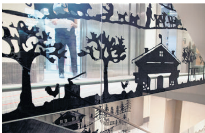
Une poya habille les escaliers de l'Agora Swiss Night.